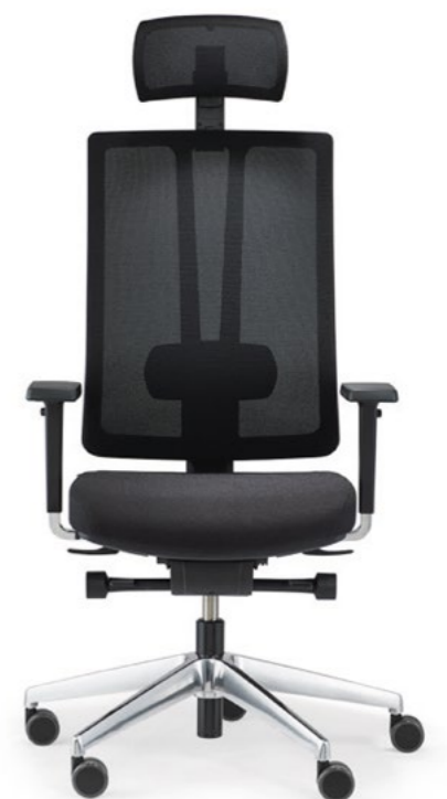
ceto novo CN95HQ1L4