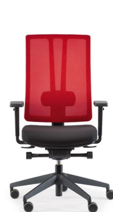
ceto novo CN25IH1L2

Das ist aber noch nicht alles, was der ceto novo an Innovationen zu bieten hat. Original Seifensand hat bei diesem Bürostuhl die neuartige Synchronmechanik M8 verbaut, die in verschiedenen Variationen erhältlich ist. Sie sorgt dafür, dass die Rückenlehne aktiv den Bewegungsablauf unterstützt. Sie folgt den Bewegungen des Anwenders – und das, wie man es auch von anderen Stühlen von Original Seifensand kennt, sehr weit nach vorn. Weitere Features der M8 sind die arretierbare Rückenlehne in fünf Positionen, die Sitztiefenverstellung um sechs Zentimeter und der einstellbare Anlehndruck auf das Körpergewicht. Im FACTS-Test konnten sich sowohl sehr leichtgewichtige (55 kg) als auch schwergewichtige Tester (120 kg) davon überzeugen, dass die Synchronmechanik immer ►